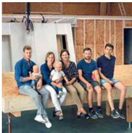
32 ALS TEAM IN DIE ERFOLGSSPUR