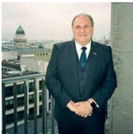
26 ZDH-PRÄSIDENT WOLLSEIFER