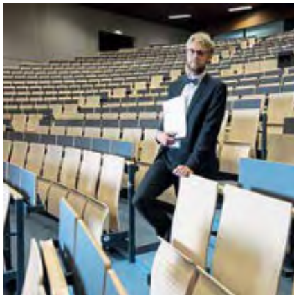
26 INTERVIEW: WISSENSCHAFTLER RUNST