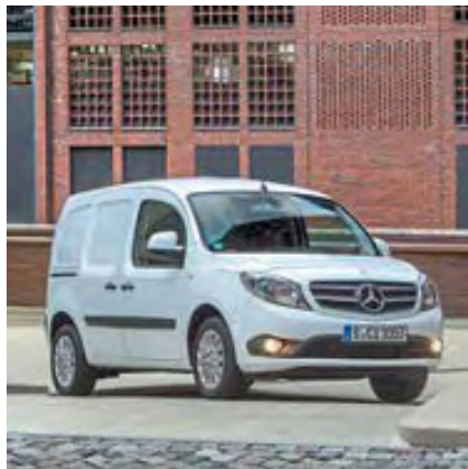
38 ÜBERSICHT: KOMPAKTLIEFERWAGEN