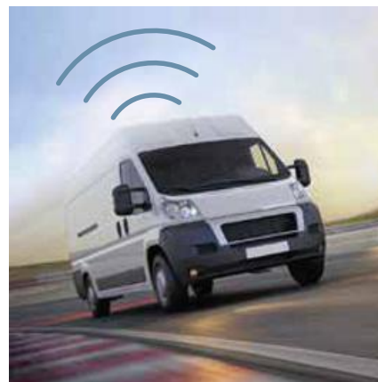
48 GERINGERE AUTOKOSTEN: TELEMATIK