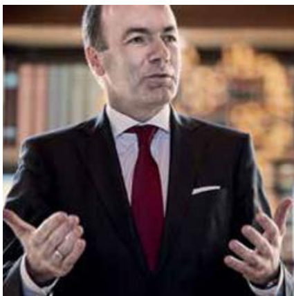
26 MEHR MITTELSTAND: MANFRED WEBER