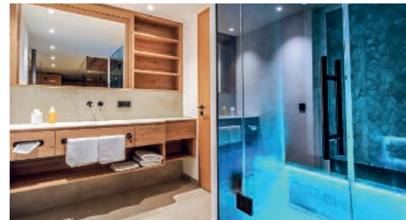
Wirthshof SPA Chalets, Markdorf