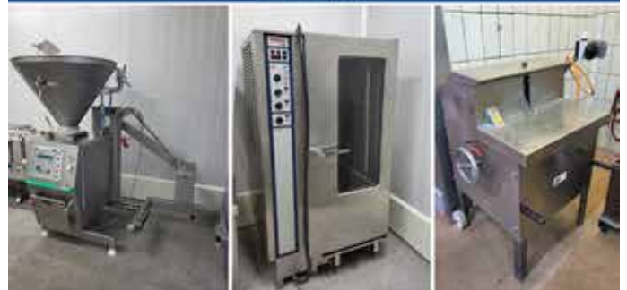
Online-Auktion von Maschinen für die Nahrungsmittelindustrie in Emmeloord (NL)