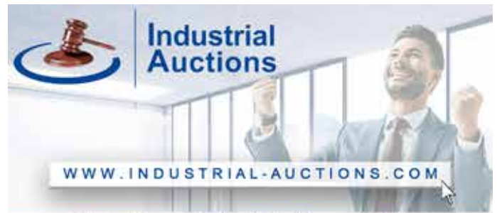
Online-Auktion von Maschinen für die Nahrungsmittelindustrie in Boxtel (NL)