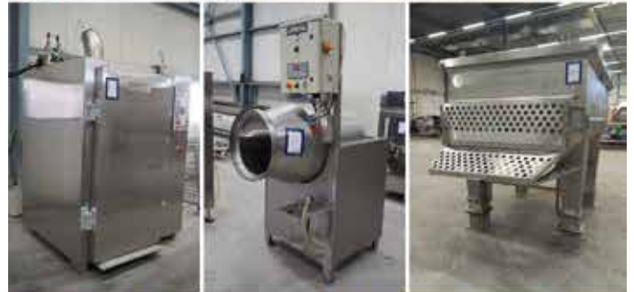
Online-Auktion von Maschinen für die Nahrungsmittelindustrie in Werne (DE)