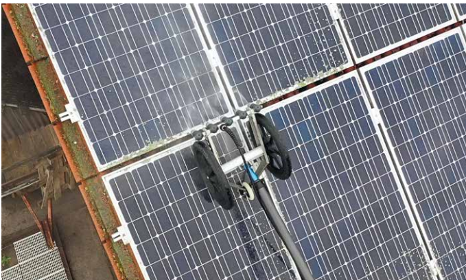
OBEN: Per Stangensystem sind mit dem Rollwagen PV-Module bis zu einer Auslage von etwa 12 m vernünftig erreichbar.