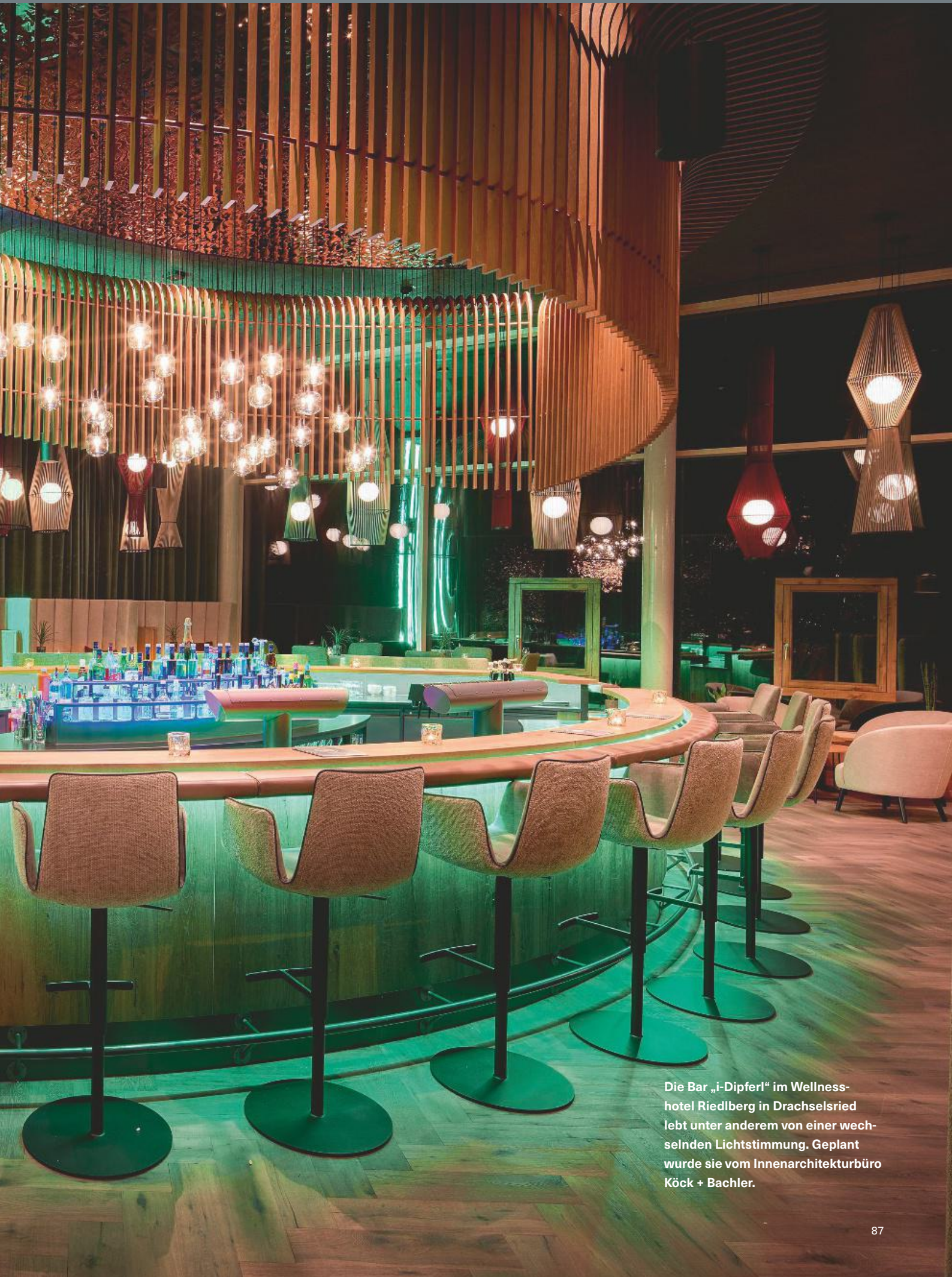
Die Bar „i-Dipferl“ im Wellnesshotel Riedberg in Drachselsried lebt unter anderem von einer wechselnden Lichtstimmung. Geplant wurde sie vom Innenarchitekturbüro Köck + Bachler.