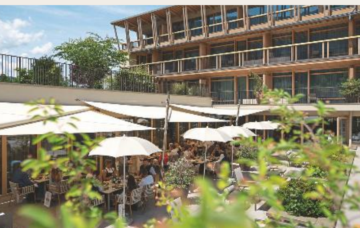
Genuss im Grünen: Award-Lunch auf der Terrasse des Falkensteiner Hotels Kronplatz.