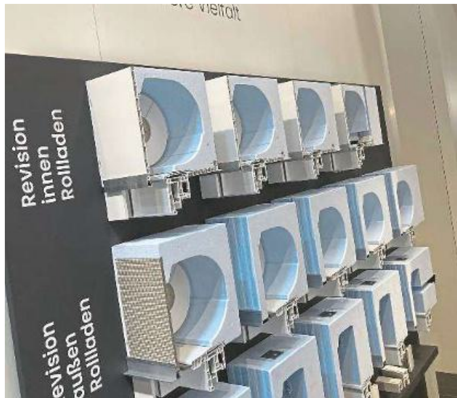
Auf der viertägigen Branchenschau werden mehr als 600 Aussteller aus aller Welt erwartet. Die Messe ist vom 24. bis 26. März täglich von 10 bis 18 Uhr geöffnet, am 27. März von 10 bis 17 Uhr.

Das Forum in Halle 7A, Stand 123, liefert praxisnahes Wissen u.a. zu Branchenthemen wie die Zukunft der Fenster- und Türenbranche, Innovationsförderung, aktuelle Anforderungen an die Fenster- und Fassadenbranche, Chan-