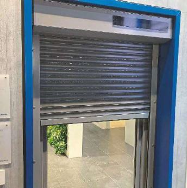
Rollladen- und Sonnenschutztechnik sowie Steuerungen werden in den Hallen 4A bis 7A ausgestellt.

schrift GFF Glas Fenster Fassade. Das Bau- und Ausbauhandwerk steht vor großen Herausforderungen: Digitalisierung, KI, Fachkräftemangel und neue Kundenanforderungen verändern die Spielregeln.