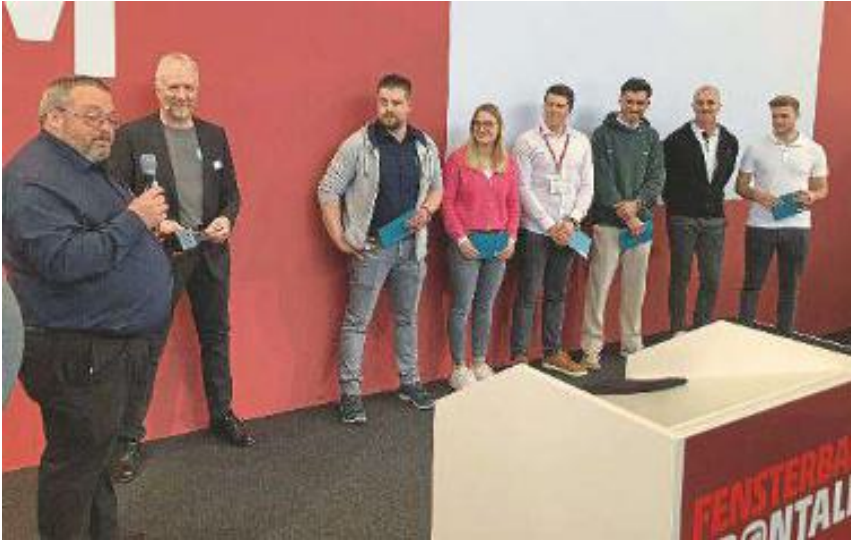
Am Messedonnerstag werden traditionell auf dem Forum in Halle 7A der Meister Award (Foto) des Fachverbands GFF Baden-Württemberg verliehen sowie die Preisträger im Wettbewerb Fensterbauer des Jahres 2026 geehrt.

Chance für die Branche; 13.30 Uhr bis 14.15 Uhr, Fensterbauer-Stammtisch. Das Programm im Forum wird ausgezeichnet und wird nach der Messe auf YouTube zur Verfügung gestellt.