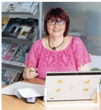
62 RICHTIG REAGIEREN

ChatGPT / Finanzspiegel / Cyberklau / Investmentfonds / Vermögen