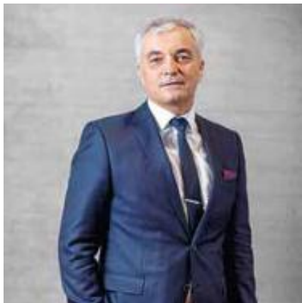
22 WISSEN TRANSFERIEREN