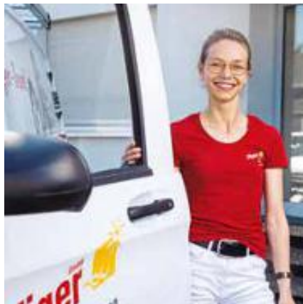
30 BETRIEB ÜBERNEHMEN