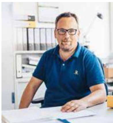
48 VERSICHERUNGEN VERGLEICHEN