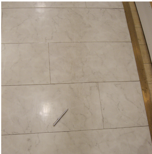
Schatten durch mangelhaftes Polieren.