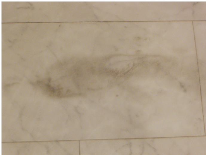
Die Pflegefilm-Schmutzanhaftung schien auf den ersten Blick nur sehr schwer entfernbar zu sein.