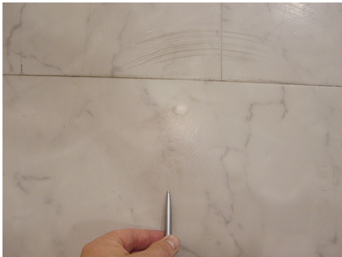
Riefen durch die Polierbürste.

Der Boden wurde durch die entstandene Wärme so weit in Mitleidenschaft gezogen, dass die Borsten der Polierbürste Vertiefungen in den PVC-Belag eingebraunt haben.