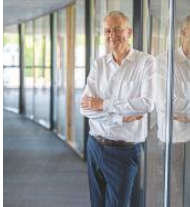
54 ADIEU GREENWASHING