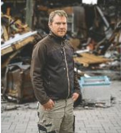
44 SCHUTZ IM FALL VON STILLSTAND