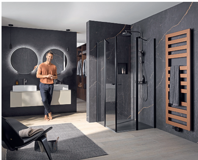
Mit dem Remake der Duschkabinenserie Exklusiv 2.0 konnte sich HSK einige Designpreise sichern.