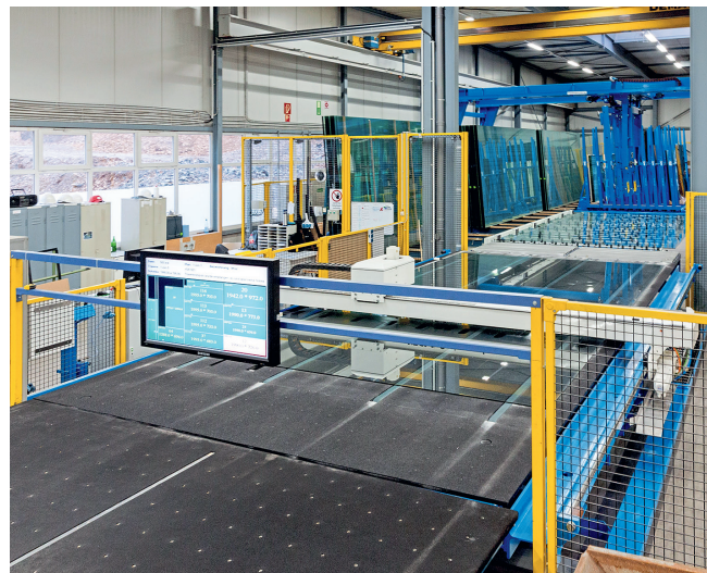
Ein Blick hinter die Kulissen: die hauseigene Glasanlage am Standort Olsberg bei HSK Duschkabinenbau.

Sie beispielsweise einen großen Bedarf dafür am Markt sehen?