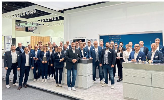
Das verlässliche HSK-Messteam auf der diesjährigen ISH in Frankfurt am Main.

den Si Best of SHK Award. Aktuell bieten wir die Serie mit einer Lieferzeit von sieben Tagen an.