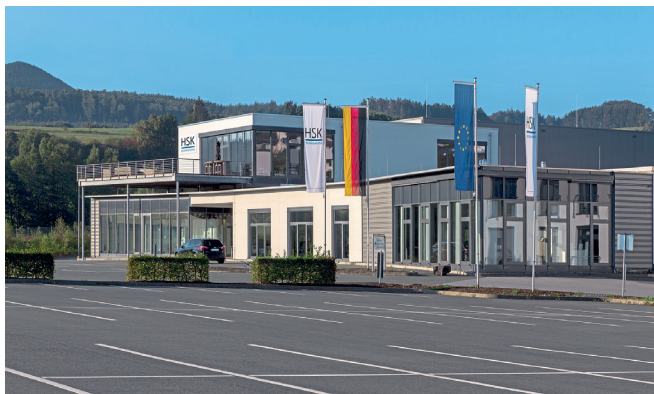
Das moderne HSK-Duschcabinebau-Firmengebäude am Standort in Olsberg im Sauerland.