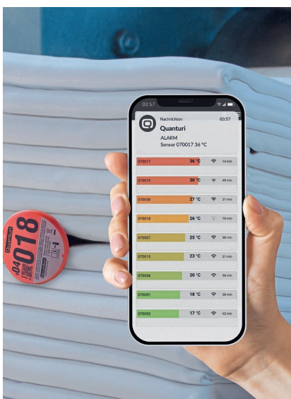
Eine Sonde misst die Temperatur in der Wäsche. Eine Software informiert, wenn es zu warm wird.