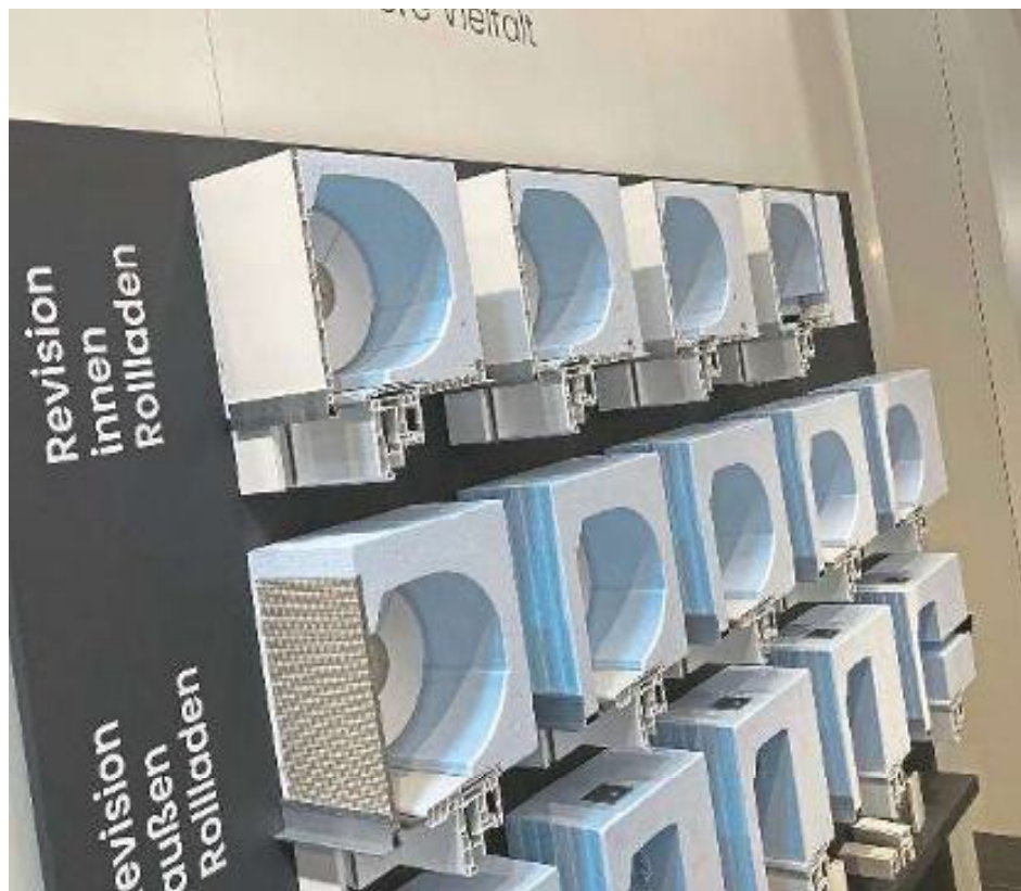
Auf der viertägigen Branchenschau werden mehr als 600 Aussteller aus aller Welt erwartet. Die Messe ist vom 24. bis 26. März täglich von 10 bis 18 Uhr geöffnet, am 27. März von 10 bis 17 Uhr.

Das Forum in Halle 7A, Stand 123, liefert praxisnahes Wissen u.a. zu Branchenthemen wie die Zukunft der Fenster- und Türenbranche, Innovationsförderung, aktuelle Anforderungen an die Fenster- und Fassadenbranche, Chan-