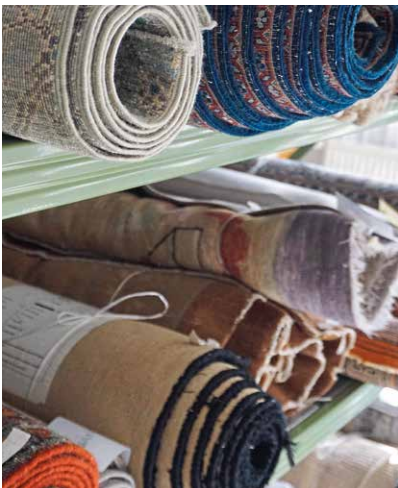
Abholbereit: Teppiche in allen Formen, Farben und Mustern.