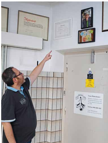
Meisterbriefe, Auszeichnungen und Fotos der vergangenen Jahrzehnte.