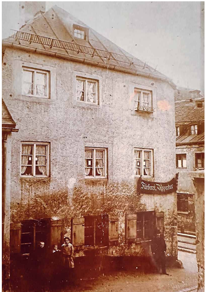
Die zweite Geschäftsstelle in der Quellenstraße am Auer Mühlbach um 1920 - 1930 in der bayerischen Landeshauptstadt.