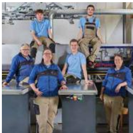
36 JUNGE LEUTE AN DIE HAND NEHMEN