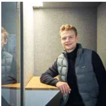
22 DIGITALE VERNETZUNG