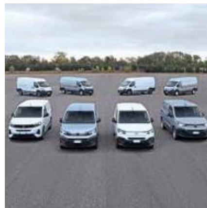
48 AUTOBAUER IM PAUKENSCHLAG-MODUS