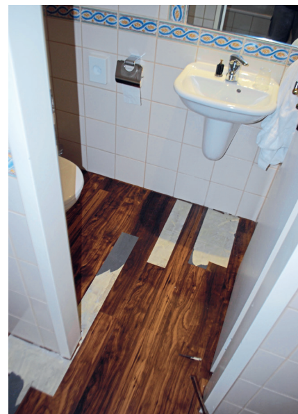
... nach kurzer Nutzung schadhaf in WC ...