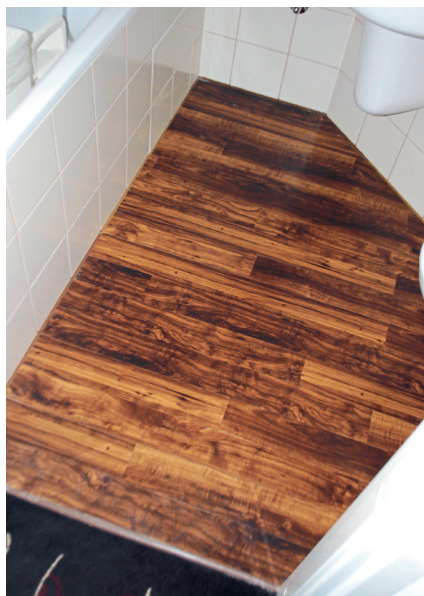
Hotel im Bestand: PVC-Designbelag auf Fliesen im Bad scheinbar schadensfrei ...

Zur Befunderhebung wurde der PVC-Designbelag in Bad, Dusche und WC jeweils in Augenschein genommen und inspiziert, sowie an ausgewählten Prüfstellen weitergehend untersucht. Dabei resultierten folgende Befunde: